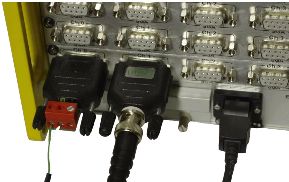
THIA- und HVA-Eingangsadapter am Traveller CF-System

Mit den unterschiedlichen Eingangsadaptern werden die Einsatzmöglichkeiten von Traveller CF- und Traveller Static-Systemen deutlich erweitert.